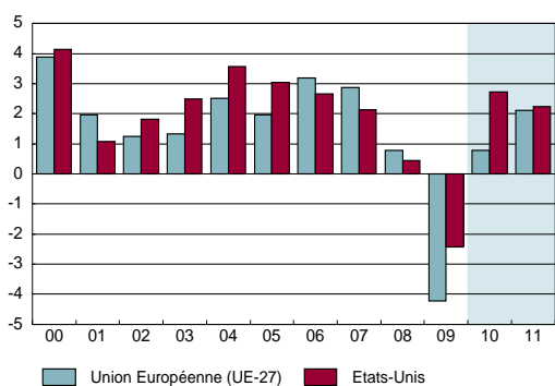
Graphique 1 EU/ Etats-unis: PIB réel (Variation en %)